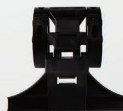
*INCOBLOCK ARRESTO DI SICUREZZA