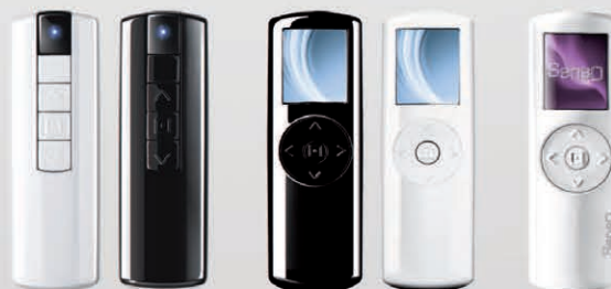
SKIPPINC Telecomando monocanale o 7 canali